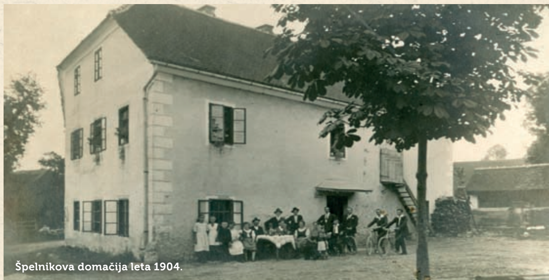
Špelnikova domačija leta 1904.

Besedilo: Gabriela Brovč.