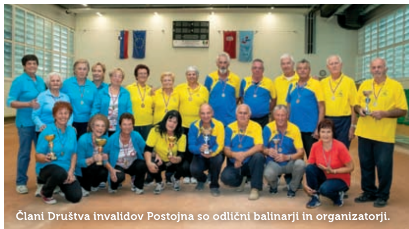
Člani Društva invalidov Postojna so odlični balinarji in organizatorji.