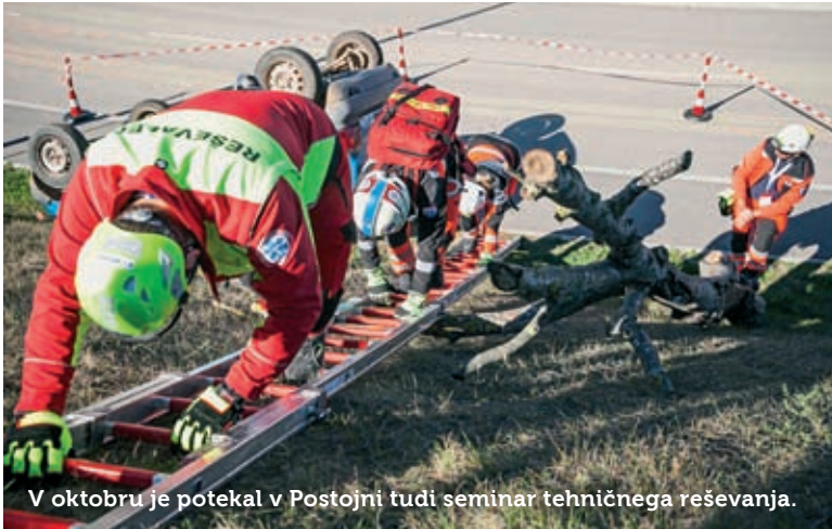
V oktobru je potekal v Postojni tudi seminar tehničnega reševanja.

Med pomembnejšimi dogodki prireditve so bili sobotno mednarodno tekmovanje 70 gasilskih ekip v organizaciji Gasilske zveze Slovenije in 10. državno tekmovanje gasilskih enot širšega pomena (na njem se je pomerilo 16 ekip), dan Alpske konvencije in petkova vaja Postojna 2019. Na slednji so sodelovali iz postojnske občine poleg gasilcev, jamarskih in gorskih reševalcev ter reševalcev Nujne medicinske pomoči še člani občinske Civilne zaščite z ekipo prve pomoči. Na predstavitvah v okviru Bogatajevih dni zaščite in reševanja so se predstavili tudi enote Rdečega križa, vodniki reševalnih psov, taborniki in skavti ter radioamaterji.