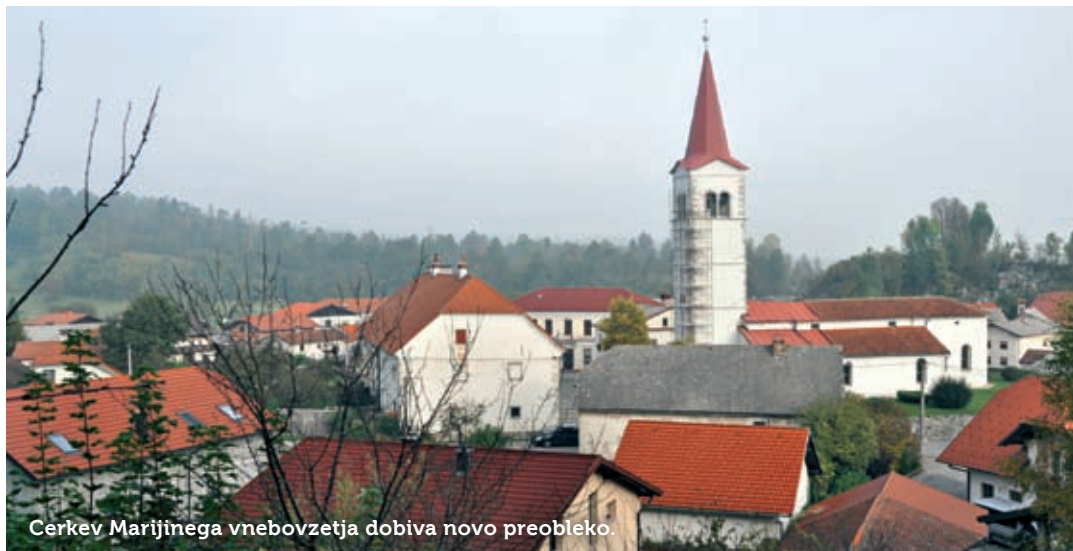
Cerkev Marijinega vnebovzvetja dobiva novo preobleko.