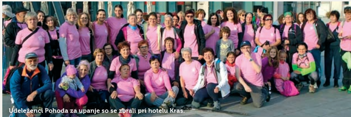
Udeleženci Pohoda za upanje so se zbrali pri hotelu Kras.

Oktoberov ovijanje dreves v rožnate pletenine je postalo prava tradicija. S tem so članice postojnsko-pivškega dela združenja Europa Donna obeležile začetek letošnjega rožnatega oktobra, da ozaveščajo o raku na dojkah. Bolezen prizadene pri nas vsako leto skoraj 1300 žensk in približno