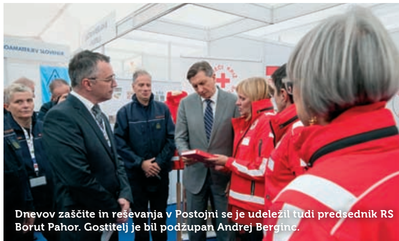
Dnevo zaščite in reševanja v Postojni se je udeležil tudi predsednik RS Borut Pahor. Gostitelj je bil podžupan Andrej Berginc.

Uprava pokriva približno 10 odstotkov površine Slovenije s 75.500 prebivalci desetih primorsko-notranjskih in kraških občin, med njimi je postojnska (poleg sežanske) poseljena najgosteje. Izpostave Uprave