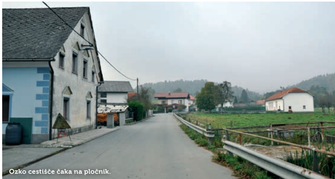
Ozko cestišče čaka na pločnik.

Slavina ima urejen vodovod, kako pa kaže s kanalizacijo in priključitvijo na čistilno napravo, se lahko samo ugiba. Občina Postojna je sestavila »čakalno vrsto« in vse je odvisno od tega, koliko denarja se nakuplja v občinsko malho. Trenutno se lahko pohvalijo, da so 24. v vrsti. Želje in smernice vodstva KS so prvenstveno povezane z zaključkom del ob gasilskem domu in ureditvi jjo cestnega dela proti Kočam.