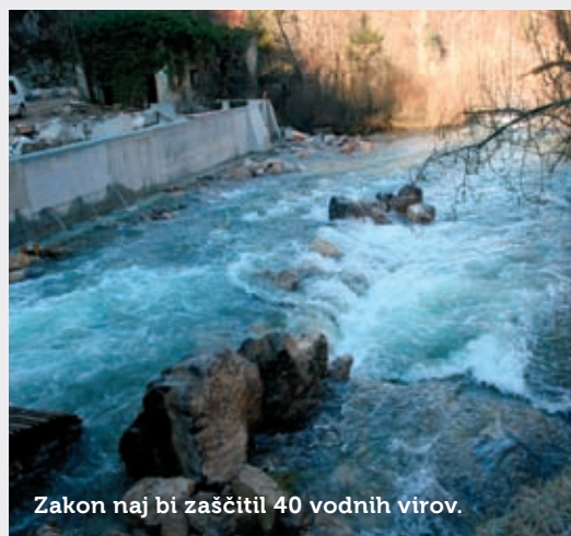
Zakon naj bi zaščitil 40 vodnih virov.

Uredba o VVO za občine Bloke, Cerknica, Ilirska Bistrica, Loška dolina in Pivka je bila v javni obravnavi od junija do konca septembra. Dokument sovпада tudi s ponovnim sprejetjem državnega prostorskega načrta (DPN) za vojaško vadišče na Počku, v nekaterih delih se celo naslanja na izsledke Geološkega zavoda Slovenije – ta je pripravil strokovne podlage za