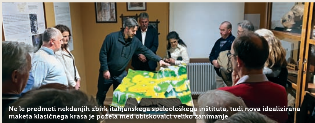
Ne le predmeti nekdanjih zbirk italijanskega speleološkega inštituta, tudi nova idealizirana maketa klasičnega krasa je požeta med obiskovalci veliko zanimanje.

V novem delu stalne razstave predstavlja Muzej del starejšega gradiva iz nekdanjih zbirk italijanskega speleološkega inštituta (danes ga hranita obe omenjeni instituciji) in tega smiselno dopolni nova idealizirana maketa klasičnega krasa. Ta ponazarja razporeditev