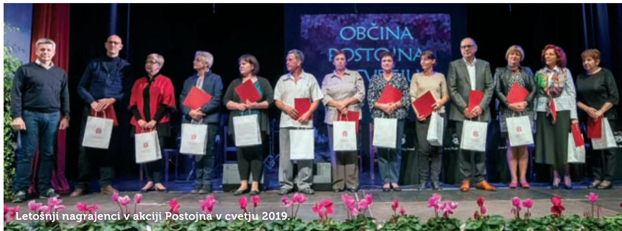
Letošnji nagrajenci v akciji Postojna v cvetju 2019.