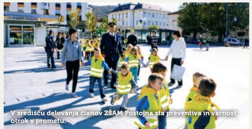
V središču delovanja članov ZŠAM Postojna sta preventiva in varnost otrok v prometu.

»Prevoznništvo je danes organizirano povsem drugače. Mlajši šoferji in predvsem mlajši šoferski upokojenci resnično nimajo časa za udeleževanje ne samo v društvu, temveč tudi na drugih področjih. In žal se