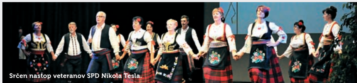
Srčen nastop veteranov SPD Nikola Tesla.

Nastopajoči so v svojih tradicionalnih nošah navdušili s folklornimi plesnimi in pevsкими