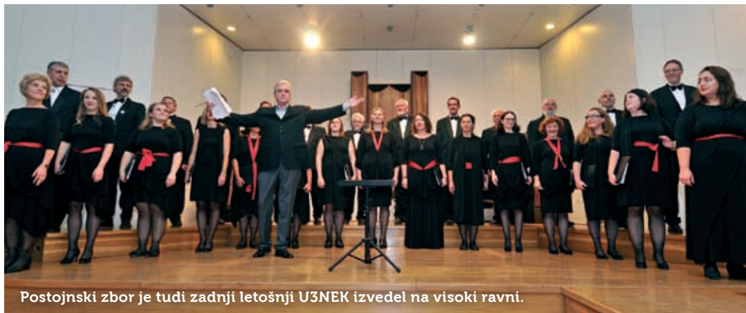
Postojnski zbor je tudi zadnji letošnji U3NEK izvedel na visoki ravni.

Za postojnske pevce je bil to za prvi nastop v novi sezoni; sledil mu je še koncert v Povirju. To so bile namreč intenzivne priprave na mednarodno zborovsko tekmovanje Claudio Monteverdi v Benetkah od 17. do 20. oktobra. Do konca leta čakajo pevce še novi nastopi –