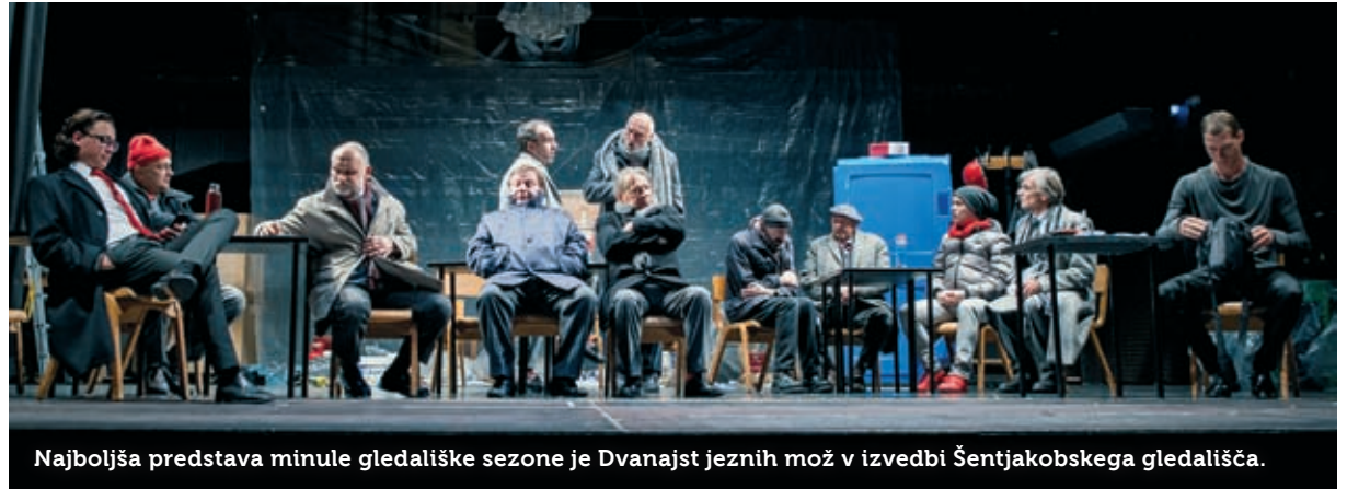
Najboljša predstava minule gledališke sezone je Dvanajst jeznih mož v izvedbi Šentjakobskega gledališča.