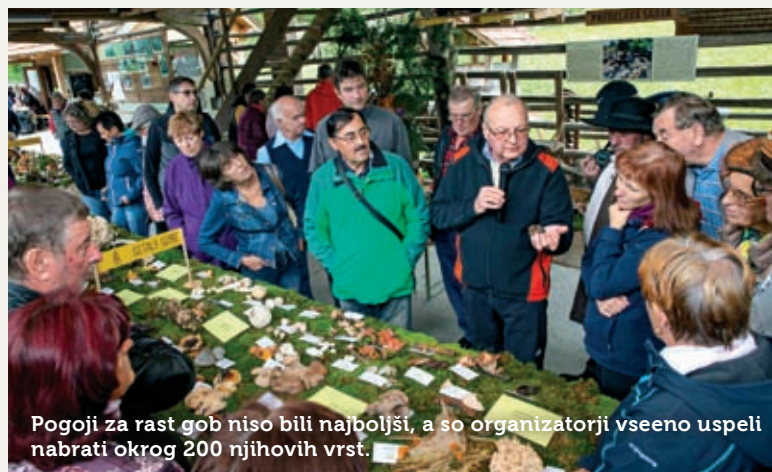
Pogoji za rast gob niso bili najboljši, a so organizatorji vseeno uspeli nabrati okrog 200 njihovih vrst.

okrog 200 njihovih vrst, med njimi je bilo 160 užitnih. Precejšnje število razstavljenih gob je bilo pogojno užitnih, manj neužitnih. Največjo pozornost seveda vedno pritegnejo smrtno strupeni primerki, ki dopuščajo samo enkratno zamenjavo. Dogodek so popestrili ljudski pevci Jezerci iz Dolenjega Jezera pri Cerknici s starimi, le redkim poznanimi vižami iz notranjske pevske zakladnice. S ponosom so se prvič predstavili v svojih štirih »novih« no-